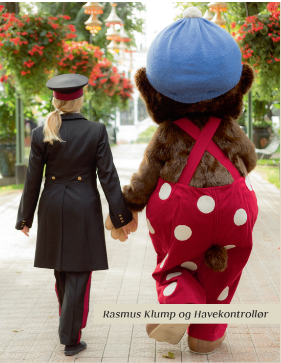
Rasmus Klump og Havekontrollør