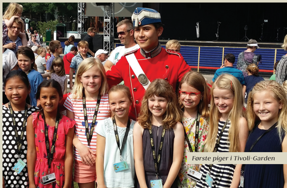
Første piger i Tivoli-Garden