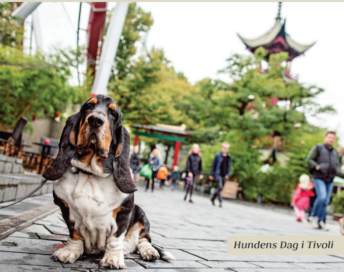
Hundens Dag i Tivoli