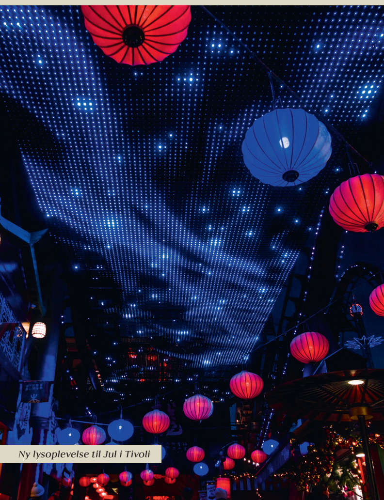
Ny lysoplevelse til Jul i Tivoli