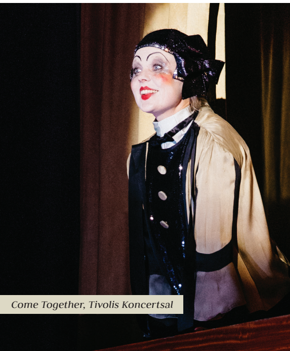
Come Together, Tivolis Koncertsal