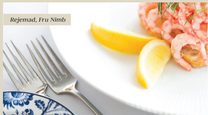
Rejemad, Fru Nimb