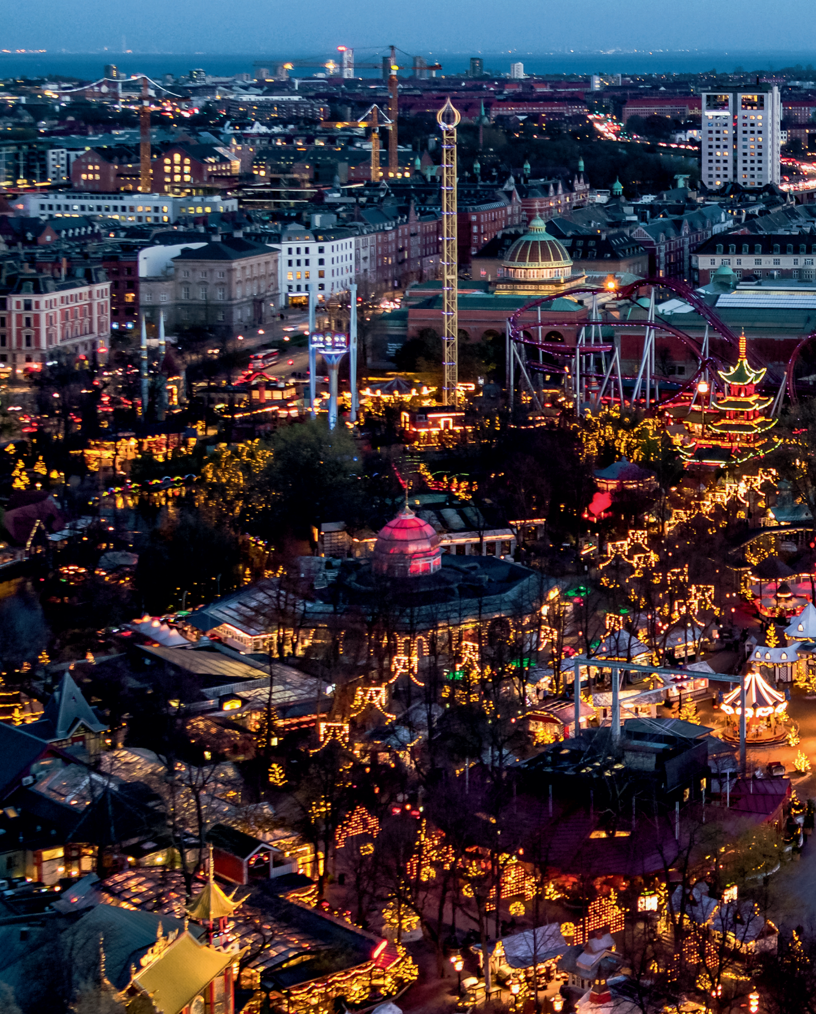
TIVOLI A/S Vesterbrogade 3 1630 København V