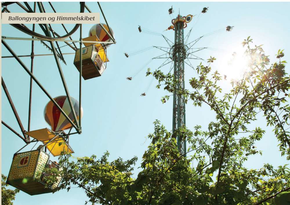
Ballongyngen og Himmelskibet